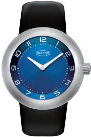
IPD007SILB "Blue Monday"