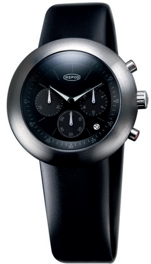
IPC007SILB30TH "Limited EDITION 30th ANNIVERSARY"