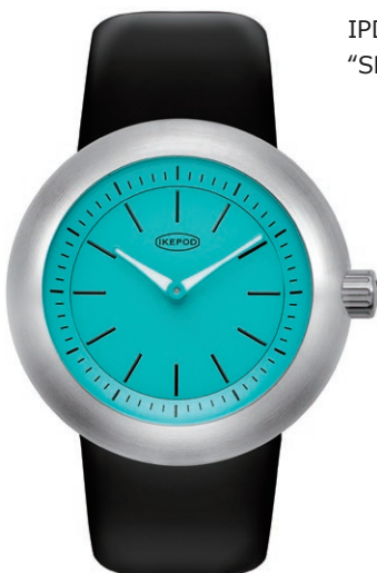
IPD009SILB "SBlue Christmas"