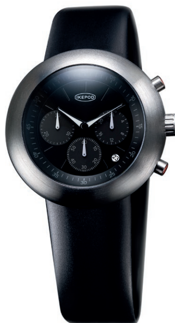
IPC007SILB30TH "Black PPK" 30th Anniversary Edition 165,000円 (税込)