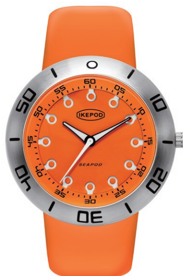
IPS008SILO30TH "30th Anniversary Edition" 297,000円 (税込)