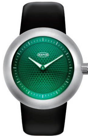
IPD002SILB "Green Eyes"