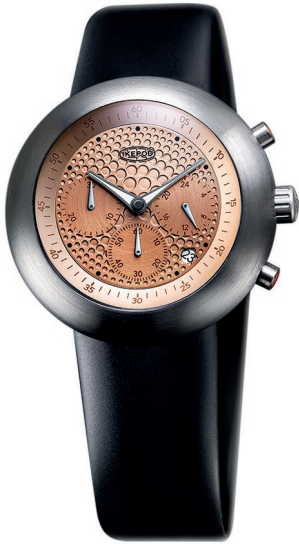
IPC003SILB "GOLD DOTS"