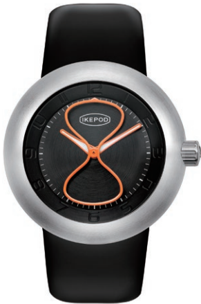
IPD001SILB "Black Glass"