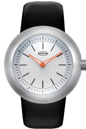
IPD016SILBN "White Lions"