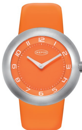
IPD030SILO "30th Anniversary Edition" 143,000円 (税込)