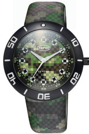
IPS003PIXLB PIXEL DIAL AND STRAP "PIXPAT BLACK PVD"