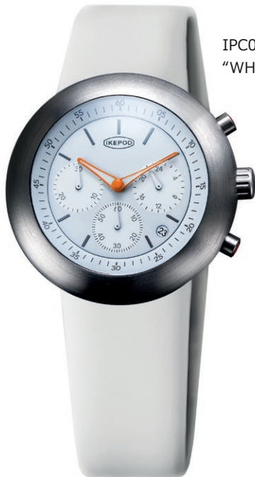
IPC013SILW "WHITE HORSES"