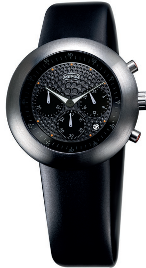
IPC004SILB "BLACK BEAUTY"