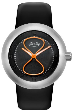
IPD001SILB "Black Glass"