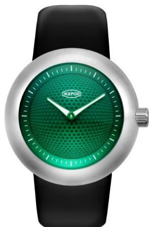
IPD002SILB "Green Eyes"