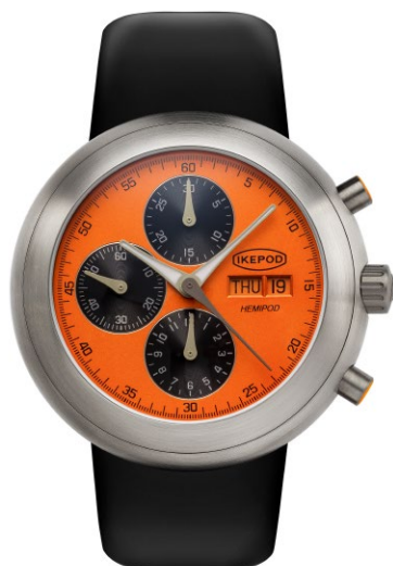
IPHE11RULB "Day Date Orange"