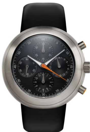
IPHE01RULB "gen3 Black"