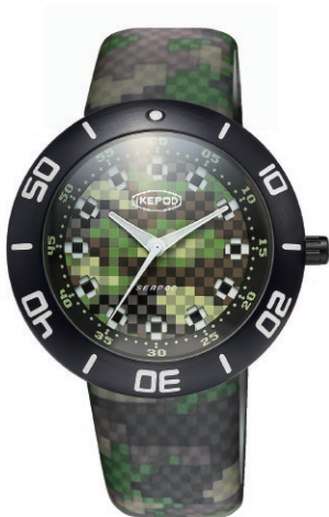
IPS003PIXLB PIXEL DIAL AND STRAP "PIXPAT BLACK PVD"