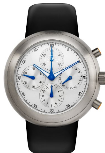
IPHE02RULB "gen3 white"