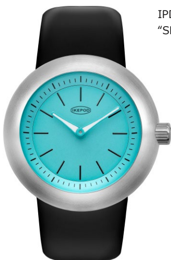
IPD009SILB "SBlue Christmas"