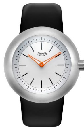
IPD016SILBN "White Lions"