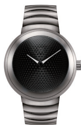
IPHO02TITL30th "LISBOA" 30th Anniversary Edition