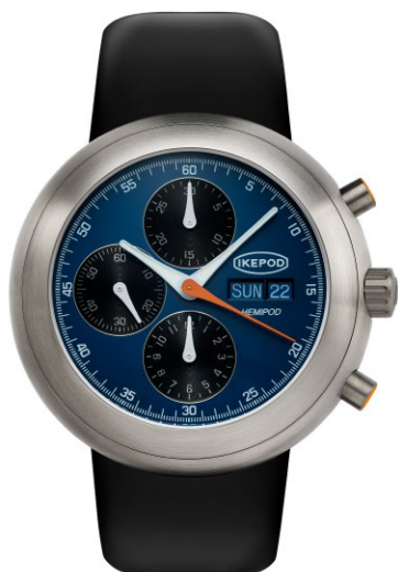
IPE10RULB "Day Date Blue"