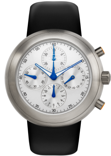
IPHE02RULB "gen3 white"