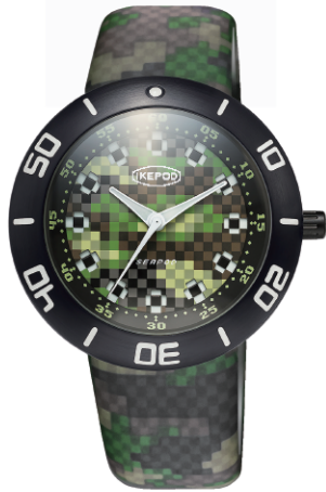
IPS003PIXLB PIXEL DIAL AND STRAP "PIXPAT BLACK PVD"