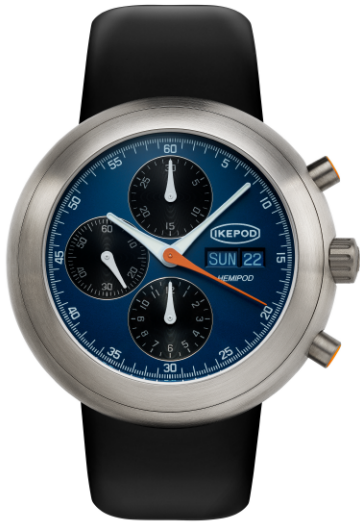
IPHE10RULB "Day Date Blue"