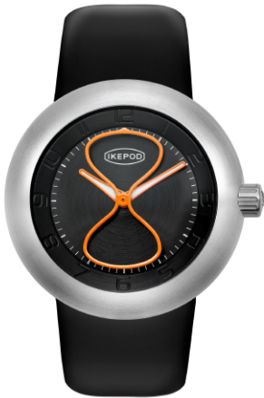
IPD001SILB "Black Glass"