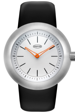
IPD016SILBN "White Lions"