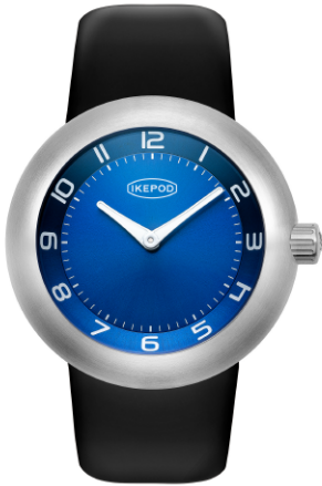
IPD007SILB "Blue Monday"