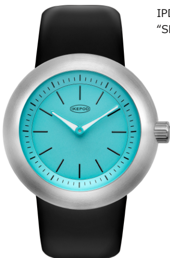
IPD009SILB "SBlue Christmas"