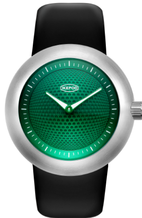
IPD002SILB "Green Eyes"